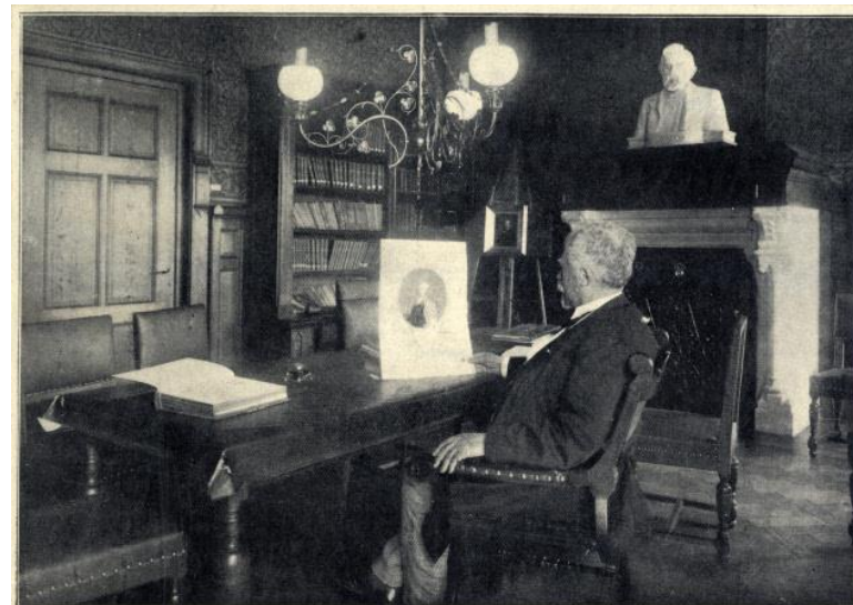
Prof. Dr. H. SNELLEN Sr. in zijn studeervertek.